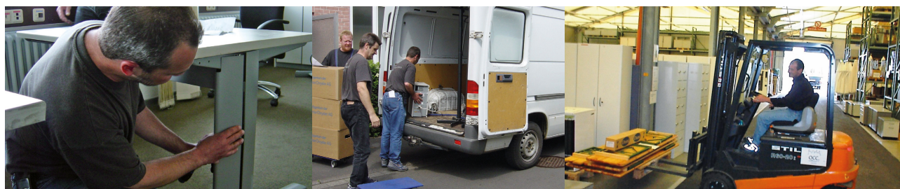
OCC-Mitarbeiter im Einsatz